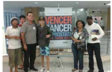
ACTC - Casa do Coração participa de ação do Novembro Azul.

O objetivo dessa campanha foi chamar a atenção dos homens para a realização do exame da próstata, alertar sobre os riscos e sintomas da doença e contribuir, por meio de informação, para a redução do desenvolvimento da doença.