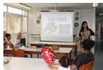
Mães/Acompanhantes participam da palestra sobre "Vacinas e Imunizações".