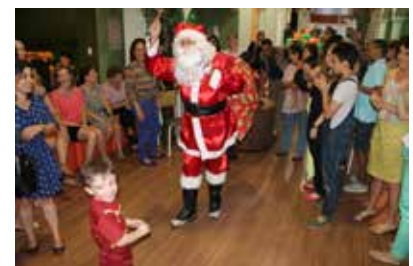
Crianças recebem a visita mais esperada da festa: o Papai Noel.