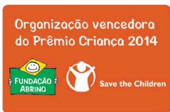
Selo oficial da Fundação ABRINQ para organizações vencedoras do Prêmio.

ACTC – Casa do Coração fica entre as quatro organizações vencedoras com o projeto Qualidade de Vida de Nossas Crianças