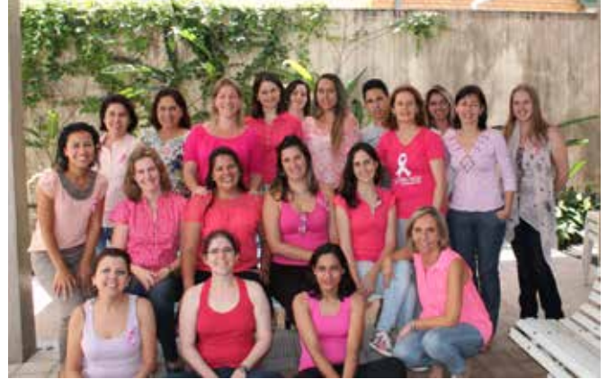
No dia 28 de outubro, como ação de apoio a campanha, todas da equipe da ACTC - Casa do Coração vestiram uma peça de cor rosa.