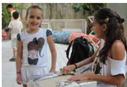
Crianças se divertem na comemoração do Dia das Crianças

Evento realizado pelo Departamento de Educação contou com presentes e muita animação