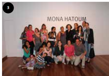
Foto 1 e 2 - Fronhas bordadas pelas mães/acompanhantes da ACTC expostas na Estação Pinacoteca, compondo a Instalação Sonhando Acordado.