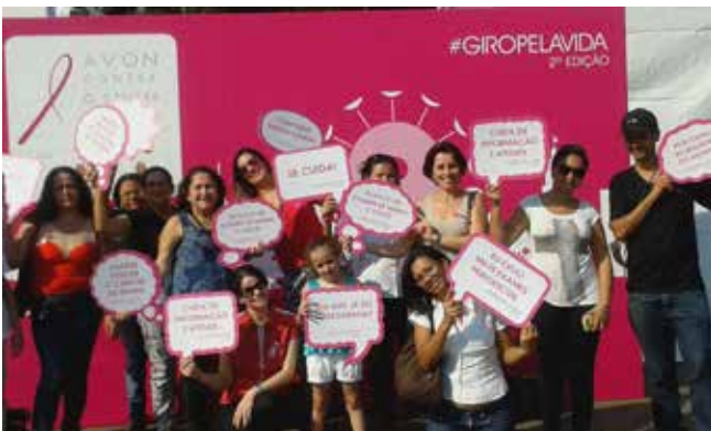
Mães/Acompanhantes, crianças, adolescentes e equipe de Serviço Social da ACTC - Casa do Coração participam da ação #GIROPELAVIDA no Parque Ibirapuera, promovido pelo Instituto AVON.

Ao final tiraram fotos com plaquinhas de apoio à Campanha para postarem nas redes sociais, com #giropela vida e contribuíram com R$1,00 para o Hospital de Câncer de Barretos a cada foto postada.