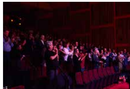
Banda Mantiqueira fecha as apresentações do ano de 2014, com um espetáculo aplaudido de pé pelo público presente no teatro Cetip.