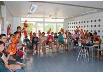
Mães/Acompanhantes e funcionários participam do Amigo Secreto promovido pelo Serviço Social.

Para comemorar o Natal e a chegada do Ano Novo, a ACTC – Casa do Coração promoveu alguns eventos para funcionários, voluntários, mães/acompanhantes, crianças e adolescentes.