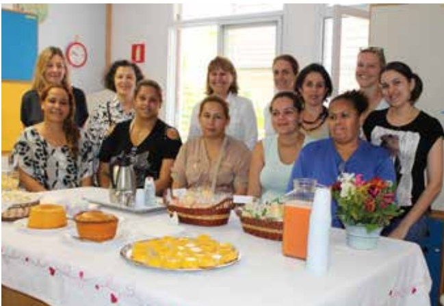
Artista Mona Hatoum (segunda pessoa em pé, da esquerda para direita) promoveu um café da tarde com as mães/acompanhantes, educadora e diretoras da ACTC - Casa do Coração.

Além da própria instalação formada por 33 fronhas de travesseiros bordadas com os sonhos e desejos das mães/acompanhantes da ACTC – Casa do Coração, Mona também nos visitou em vários momentos e promoveu um café da tarde no dia 28 de novembro. Nesse momento, todas as mães foram convidadas a compartilhar a experiência de fazer parte do projeto e bordar os próprios sonhos. Foi um momento de muita emoção.