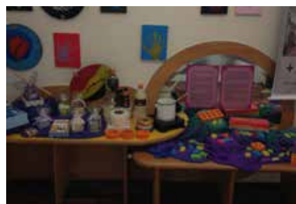
Espaço organizado com os trabalhos das crianças e dos adolescentes para a 3ª Mostra Pedagógica, realizada na festa ACTC - Casa do Coração 20 anos